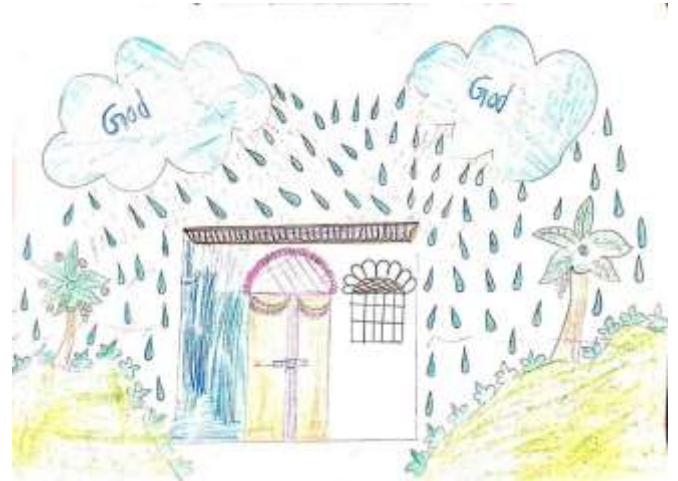
प्राथमिक विद्यालय के छात्र एवं छात्राओं द्वारा आपदा प्रबन्धन पर तैयार किये गये पोस्टरर्स